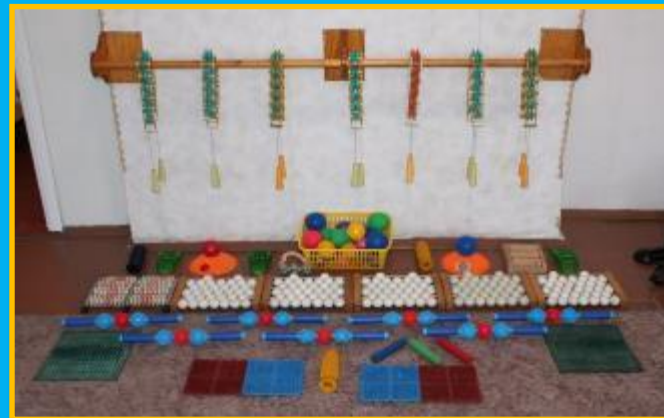
Массажные и коррекционные дорожки