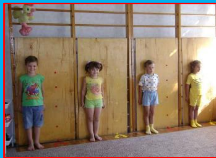
стена для выравнивания осанки