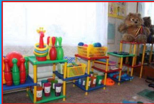
Массажные мячи, ручные массажёры, платочки