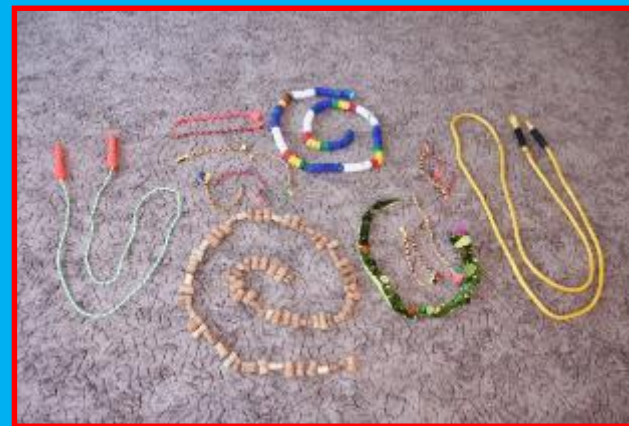
Различные виды канатов