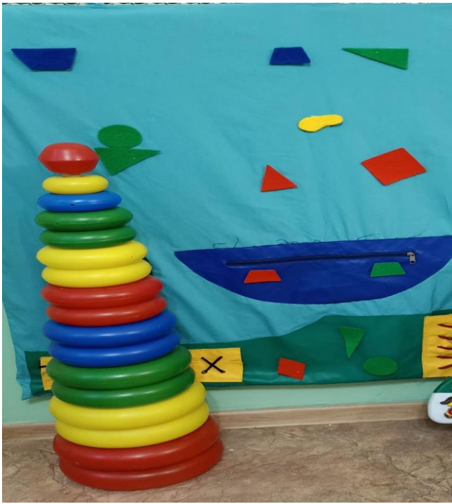
Центр конструирования из деталей (среднего размера)