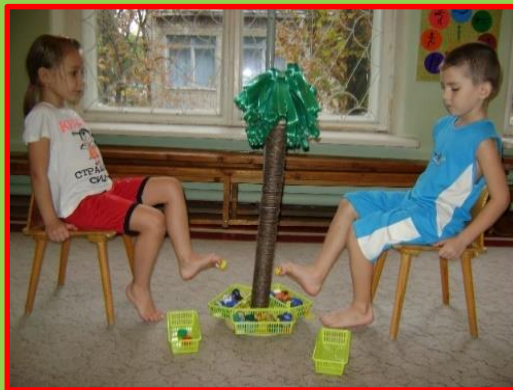
Собирание предметов пальцами ног