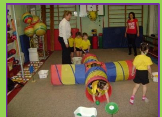
«В кладовке у мышки»