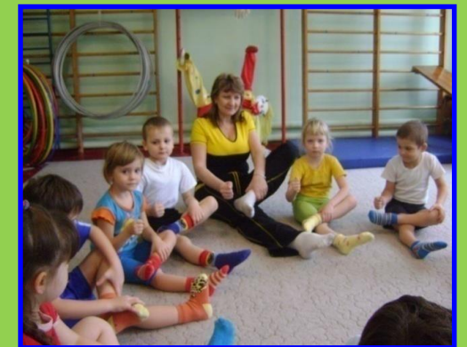
Игровой самомассаж стоп