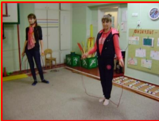
Соревнование со скакалкой