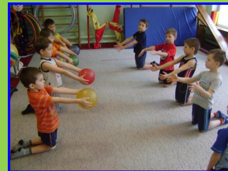
Тренировка из разных исходных положений