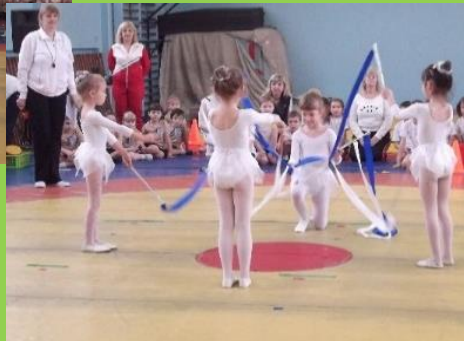
Выступление воспитанниц МБДОУ д/с 62