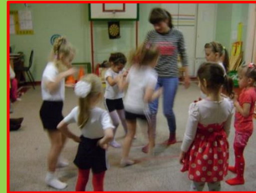
С мамочкой интересно!!!