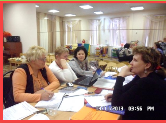
- работа в ТГ при ГБОУ ДПО РО РИПК и ППРО