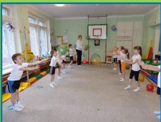
Физкультурное занятие со старшими дошкольниками