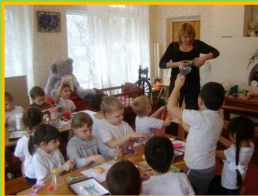
«Изготовление с детьми спортивной игрушки «Ловушки»