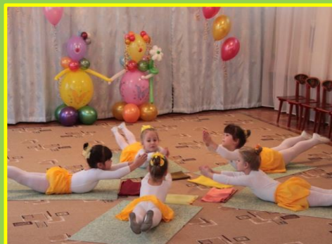
«На балу у королевы Осени»