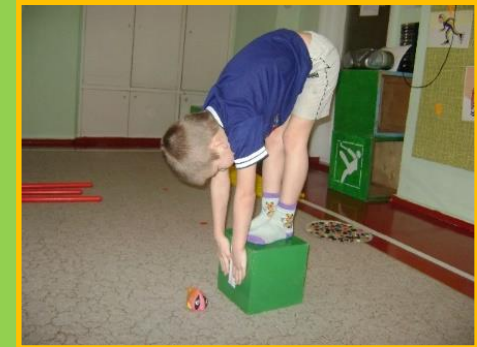
Тест «Ловись рыбка»