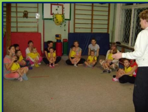
Подвижная игра «Птички в гнездышках»