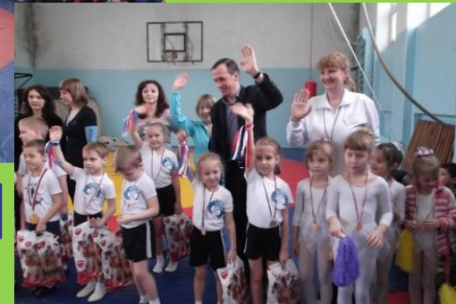
Награждение участников Олимпиады