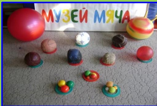
Такие разные мячи

Цель : приобщение детей дошкольного возраста к спорту.