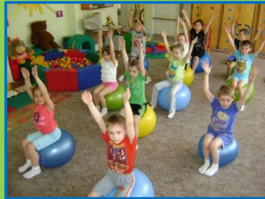
Самовытяжение упр. «К солнышку»