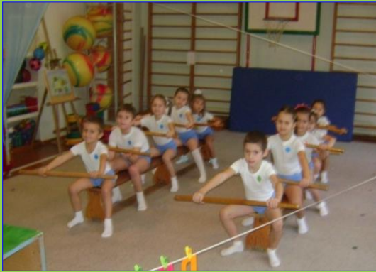
По Дону на лодках

Цель -приобщение детей к культурно – историческим традициям Донского края