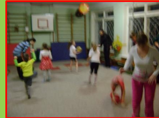
Игра с мячом «Имена»