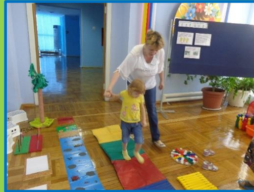
Упражнения для профилактики плоскостопия