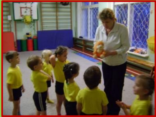
«Бельчонок просит найти маму»

Цель: Создание условий для совместной двигательной-игровой деятельности детей и родителей