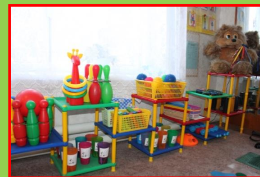
Мелкий коррекционный материал