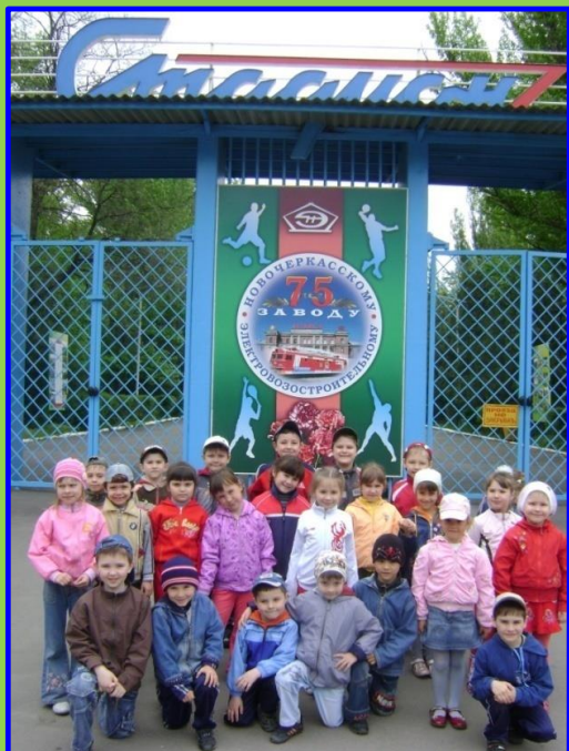
Мы выбираем спорт!