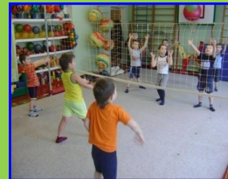
Соревнования по Пионерболу

Горизонтальный пластический балет - это новая форма физического воспитания, система оздоровления, спортивной тренировки и творческого самовыражения детей.