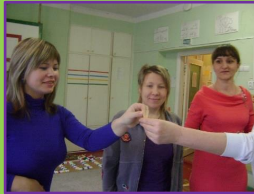
«Выбор водящего с помощью палочки»