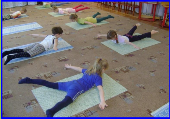
Укрепление мышц спины упр. «Звезда»