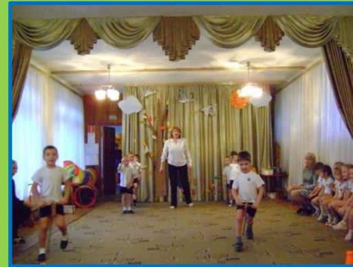
Кзаки на лошадях