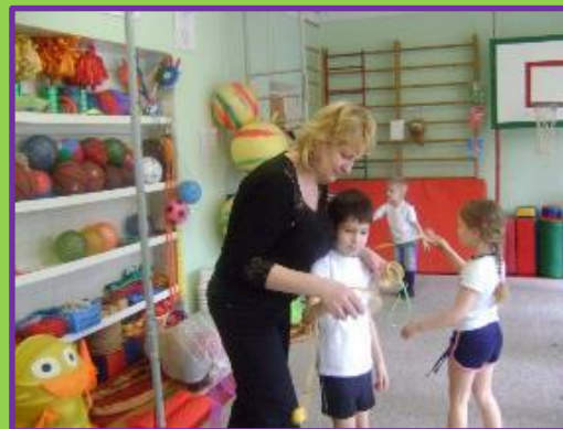
Игры с «ловушками»