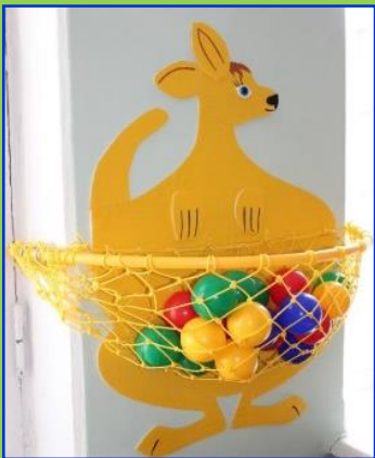
Кенгуру для метания в цель