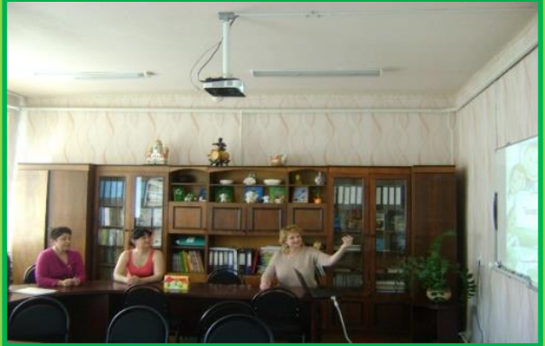
Участие в опорной площадке на базе МБДОУ №7 Презентация паспорта физкультурного зала