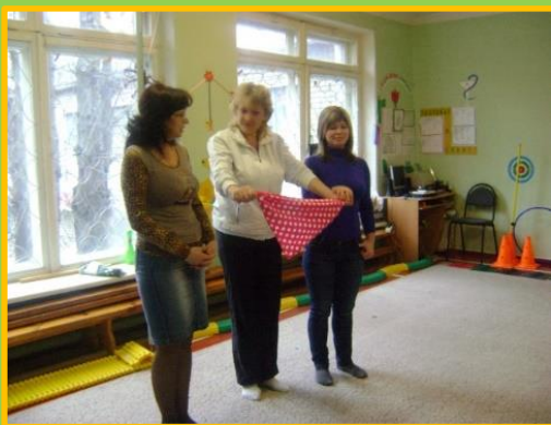
Угадай в какой руке