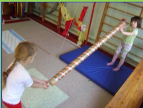
Труба «Не зевай-ка»