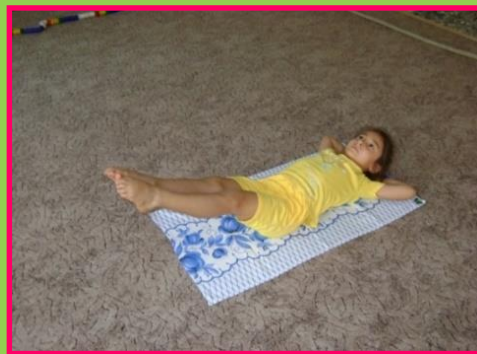
Тест «Разводной мост»