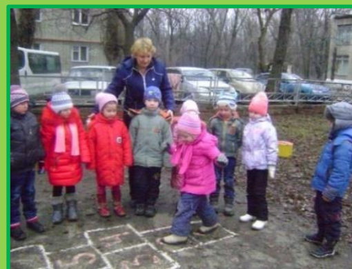
Игры на прогулке