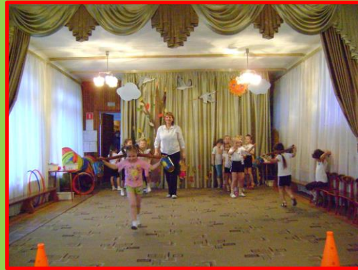
Казачки с коромыслом