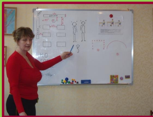
Семинар «Организация коррекционной работы с детьми, имеющими НОДА»