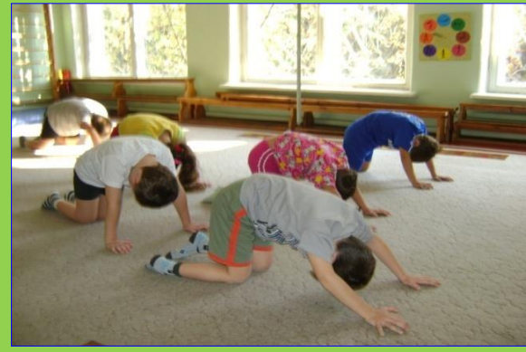
Развивает гибкость позвоночника упр. «Кошечка»