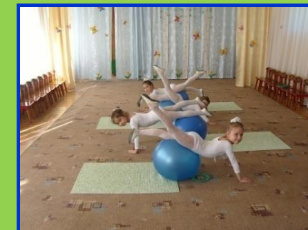
Путешествие дождевой капельки»