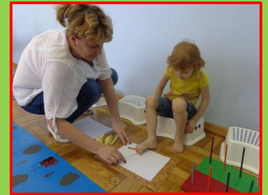
Рисуем пальчиками ног