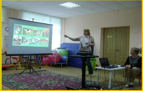
Участие в работе ГМО инструкторов по физической культуре: