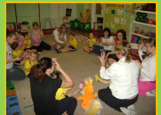
«Игровой самомассаж с орешком»