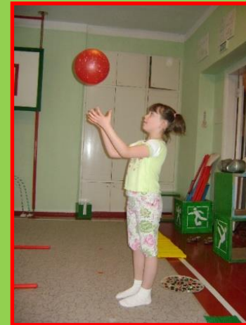
Тест «Поймай мяч»