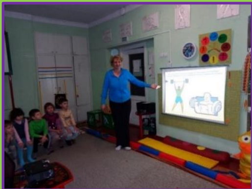
Презентация для детей «Спортивные игры»

Цель: Привлечение внимания всех участников образовательного процесса- педагогов и родителей воспитанников ДОУ к назначению и многообразию детской игры: определив ее преобладающего места в совместной деятельности детей и взрослых в ДОУ и семье.