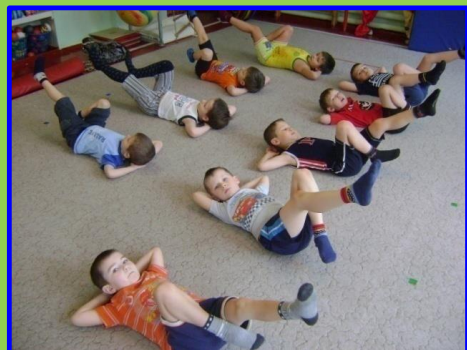
Разминка тоже обязательна Выполняй ее старательно