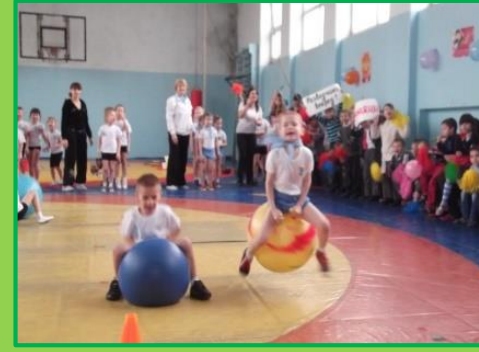
Эстафета «Прыжки на парашюте»