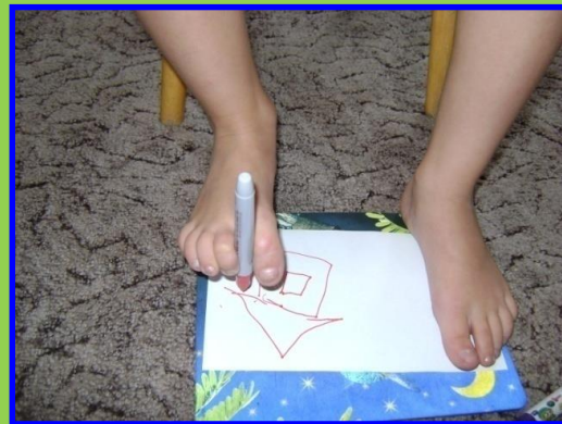
Рисование пальцами ног