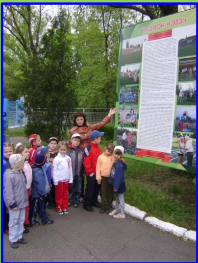
Знакомимся с историей стадиона