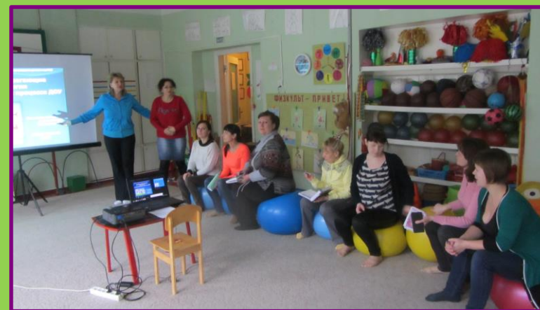
ПДС Презентация «Здоровьесберегающие технологии в работе с дошкольниками»