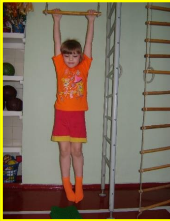
Тест «Висит груша»