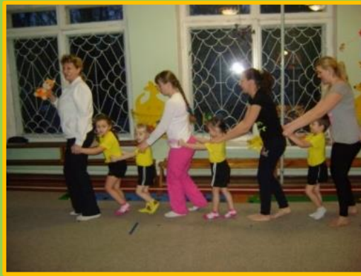
«На поезде в лес»