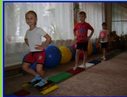
Ходьба по массажным дорожкам