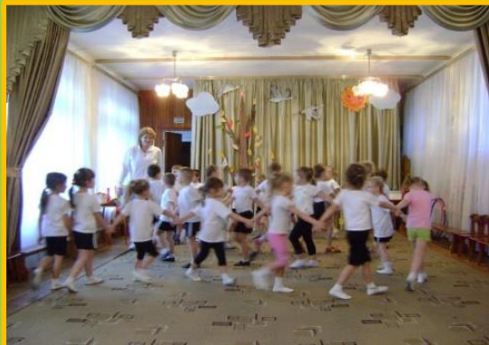
Течет Дон - батюшка