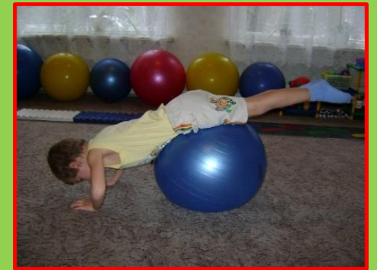
Укрепление мышц рук упр. «Силач»